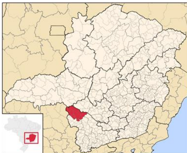
Imagem 2: Mapa da Microrregião de Passos